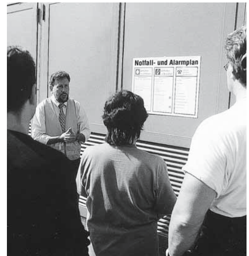
Bild 3: Das Instruieren und Anleiten der Mitarbeiter liegt in der Verantwortung der Vorgesetzten.